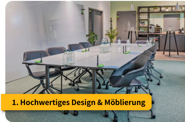
1. Hochwertiges Design & Möblierung