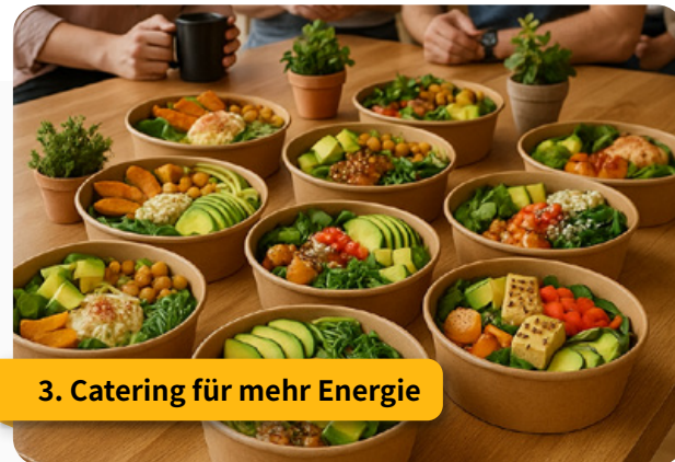
3. Catering für mehr Energie