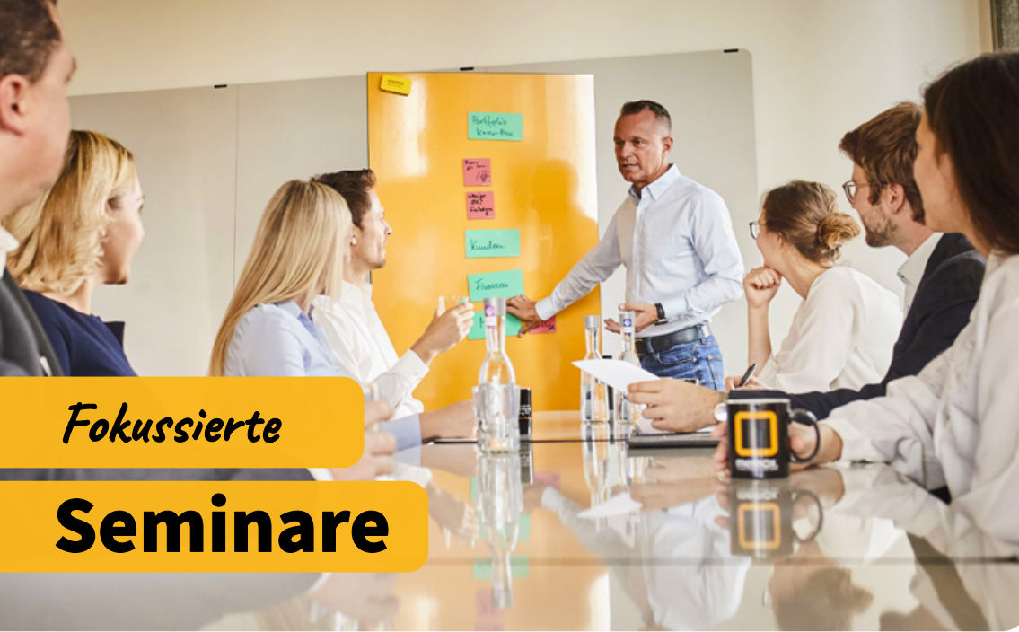
1. Arbeitsumfeld für Konzentration