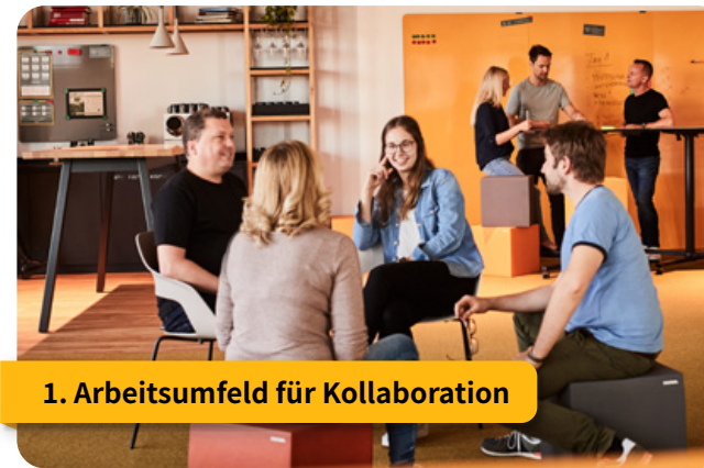
1. Arbeitsumfeld für Kollaboration