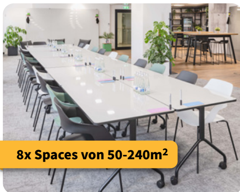
8x Spaces von 50-240m 2