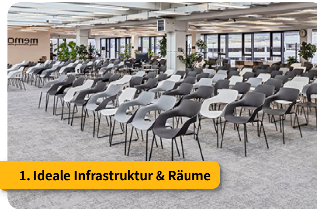
1. Ideale Infrastruktur & Räume