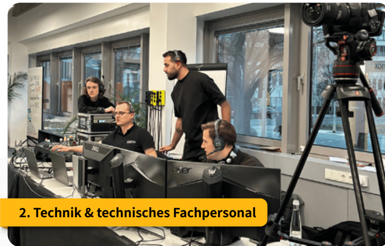
2. Technik & technisches Fachpersonal