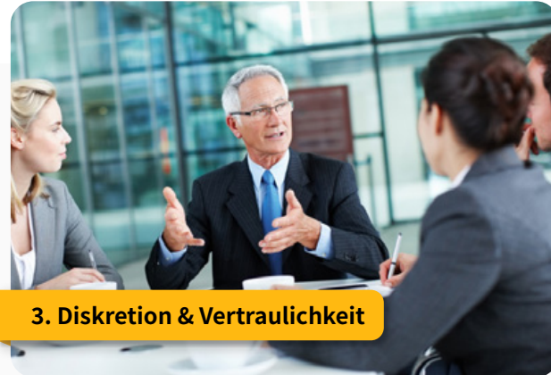
3. Diskretion & Vertraulichkeit

„Komponenten für produktive Meetings & Tagungen.“