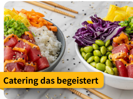
Catering das begeistert

Unsere Räume denken mit. Von der Steckdose über beschreibbare Wände bis zur Technik – jedes Detail ist so gestaltet, dass Zusammenarbeit in jedem Format erfolgreich stattfinden kann. So entstehen Orte, die mehr sind als funktional: Sie inspirieren, strukturieren und machen gute Zusammenarbeit leicht.