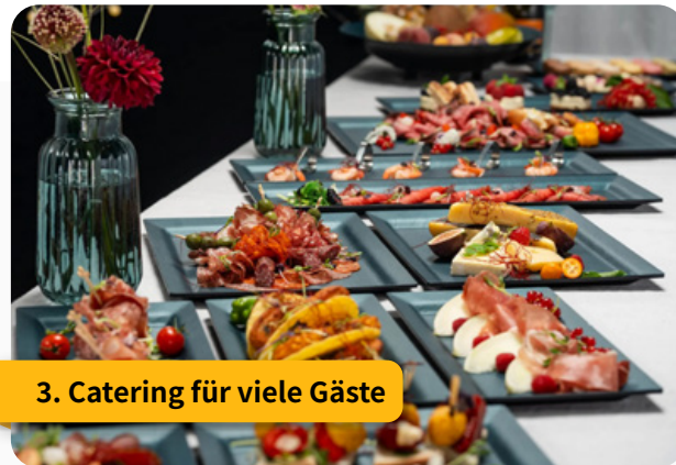
3. Catering für viele Gäste

„Komponenten, damit einfach alles reibungslos funktioniert.“