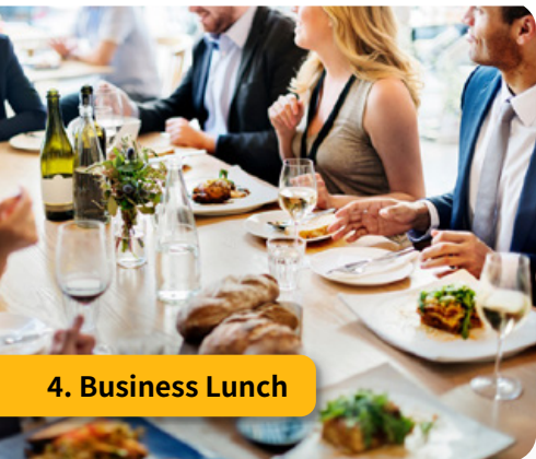
4. Business Lunch