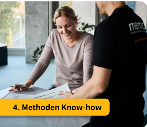
4. Methoden Know-how