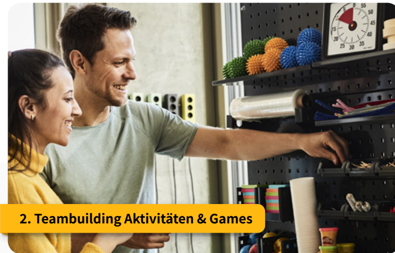
2. Teambuilding Aktivitäten & Games